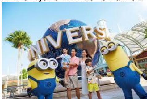
UNIVERSAL STUDIO SINGAPORE