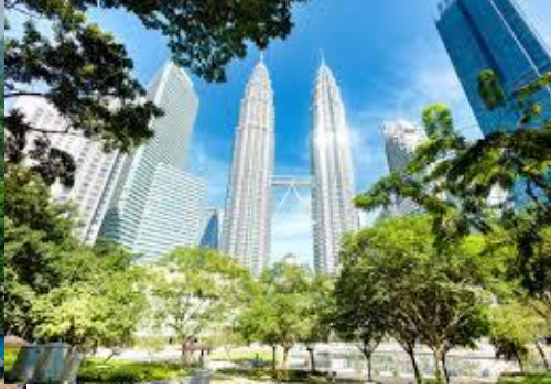
Petronas Twin Towers