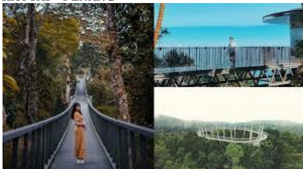
Penang Hill (OPTIONAL)