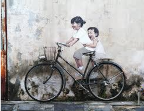
Penang Street Art