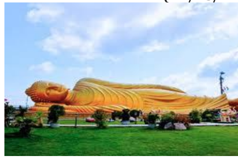
Reclining Buddha Hatyai

Sarapan di hotel dan check out, acara hari ini anda akan diajak menuju Hatyai, berbelanja di Toko Oleh-oleh berupa Kaos, Produk Kulit & Makanan, Lokal Produk Reenu . Dilanjutkan menuju Songkhla untuk mengunjungi Patung Mermaid dan Patung Buddha tidur yang merupakan salah satu patung terbesar didunia. Check in hotel dan acara bebas untuk anda. Hotel : Yannaty Hotel *3 atau setaraf